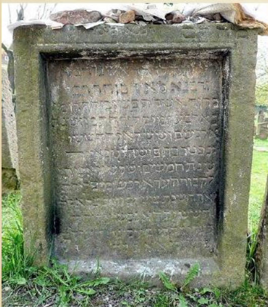
מצבת ציונו הקדוש של מהר"ם מרטנבורג.

לכאורה מסתבר לומר כי מקור הכינוי 'זיסקינד' אשר אחד במשפחה זו יסודה הוא במעשה פלא שהובא על ראש המשפחה מהר"ם מרטנבורג ז"ל.